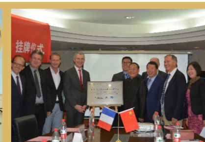
武汉-波尔多心脏专科临床医疗教学中心落户亚心