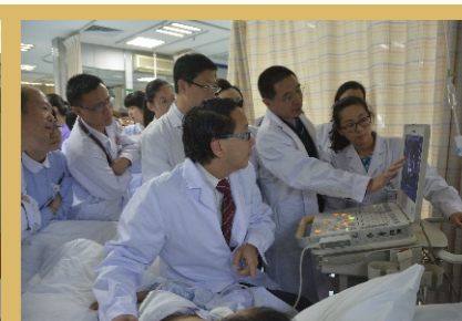
梅奥诊所专家在亚心学术交流