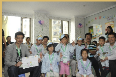
患儿向爱佑基金理事长赠送书画