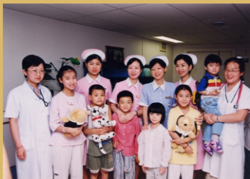
为第一批孤儿免费手术